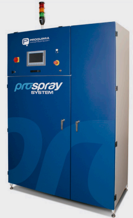
Unidad de regulación y control